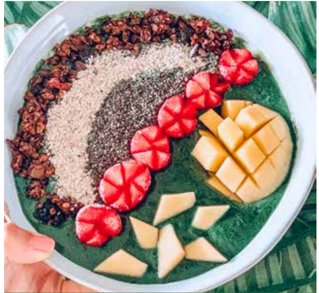
Smoothie Bowl „Spirulina“

Rezepte & Fotos www.pflanzlich-vollwertig.com