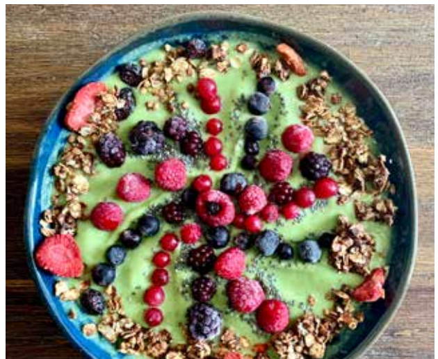
Smoothie Bowl „Erbse“